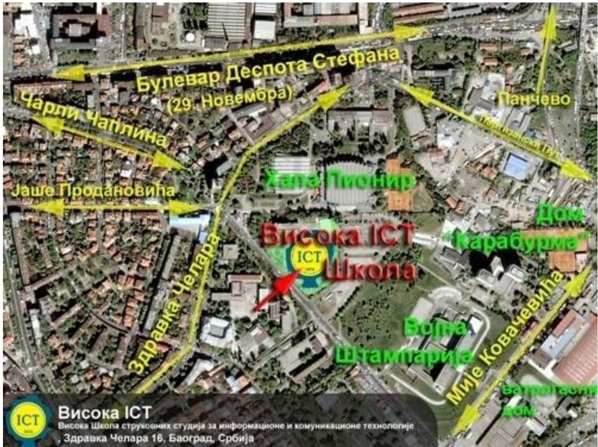
Слика 3 - Локација Високе ICT школе